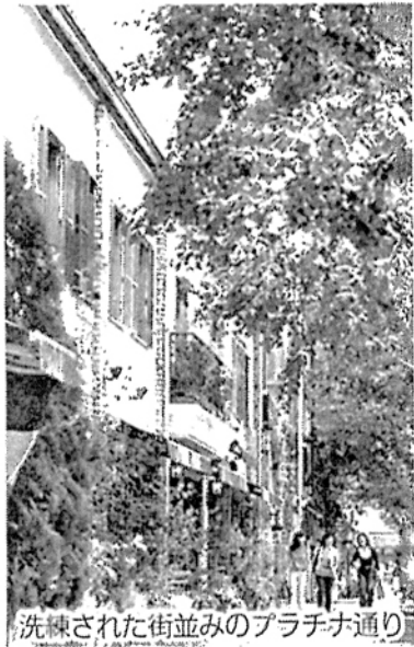
洗練された街並みのプラチナ通り